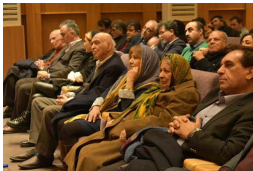
گوشه‌ای از مراسم بزرگداشت استاد مستوفی فرد