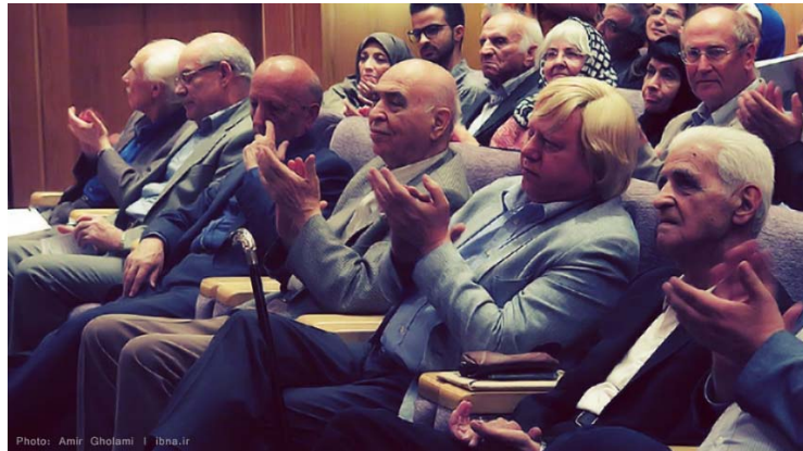
دکتر ملک در مراسم بزرگداشتش در موزه ملی ایران ۱۳۹۴

آرزوی عمری دراز داریم برای این سرو بلند سپهر باستان‌شناسی ایران که بی‌مهری ایام نتوانست قامتش رسایش را خم کند. مأخذ: